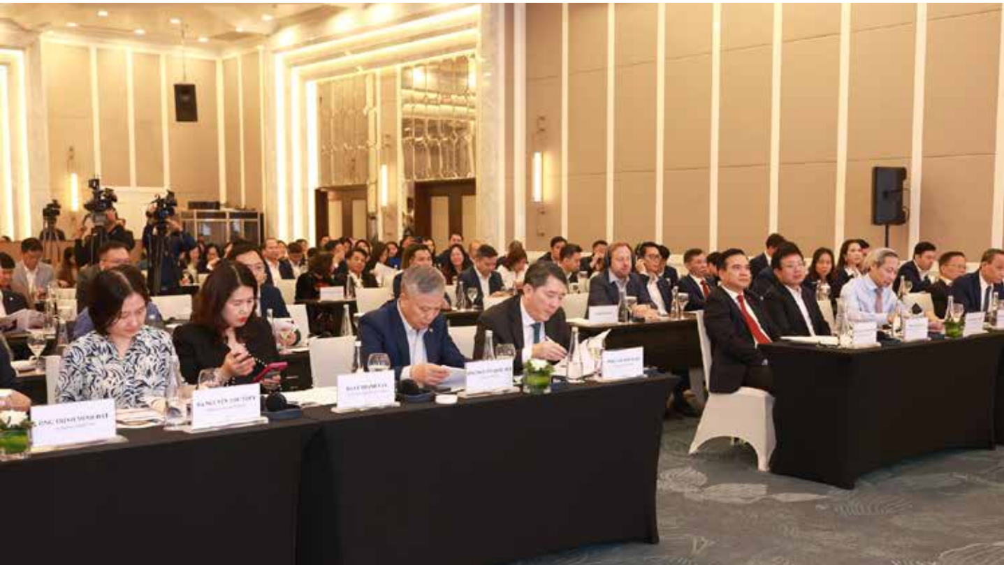
Quang cảnh buổi Hội thảo

NGÀY 3/12, TẠI HÀ NỘI, TỔNG CÔNG TY ĐẦU TƯ VÀ KINH DOANH VỐN NHÀ NƯỚC (SCIC) TỔ CHỨC HỘI THẢO “PHÁT TRIỂN MÔ HÌNH SCIC THEO HƯỚNG KINH DOANH VỐN CHUYÊN NGHIỆP, HÌNH THÀNH QUỸ ĐẦU TƯ CHÍNH PHỦ” NHẪM TIẾP TỤC LÀM RÕ, ĐỒNG GÓP VỀ CÁC NỘI DUNG VỀ PHÁT TRIỂN KINH TẾ NHÀ NƯỚC, CÙNG NHƯ ĐỊNH HƯỚNG CHO CHIẾN LƯỢC PHÁT TRIỂN SCIC TRONG THỜI GIAN TỚI.