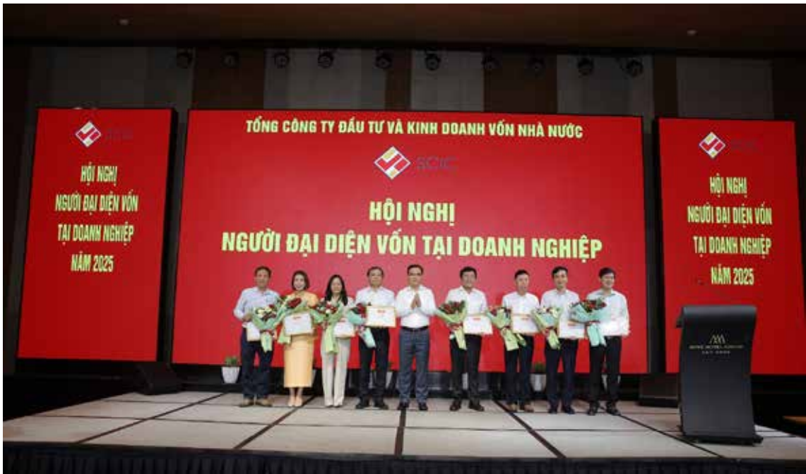
Chủ tịch HĐQT SCIC Nguyễn Chí Thành trao tặng bằng khen cho Người đại diện có thành tích xuất sắc

111 doanh nghiệp, với tổng vốn theo giá trị số sách là 61.583 tỷ đồng, trên tổng vốn điều lệ là 269.204 tỷ đồng, bao gồm: 106 Công ty cổ phần; 01 Công ty TNHH 2 thành viên; 04 Công ty TNHH MTV. Trong đó, SCIC có vốn tại 15 Tổng công ty và 01 Tập đoàn.