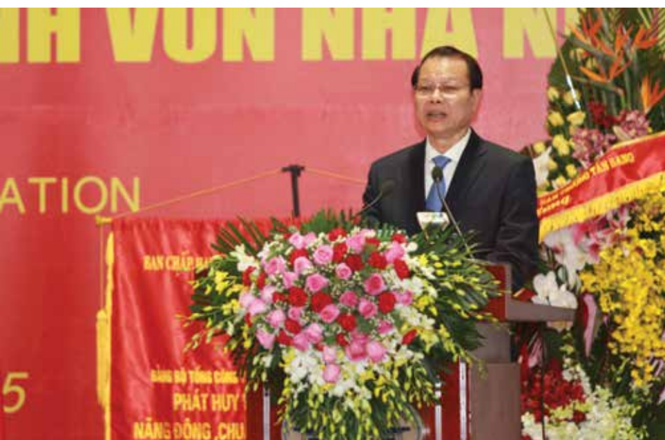
Phó Thủ tướng Vũ Văn Ninh phát biểu tại buổi lễ kỷ niệm.

chi phối tại các ngành nghề, lĩnh vực quan trọng và có tổng tài sản 46 tỷ USD.