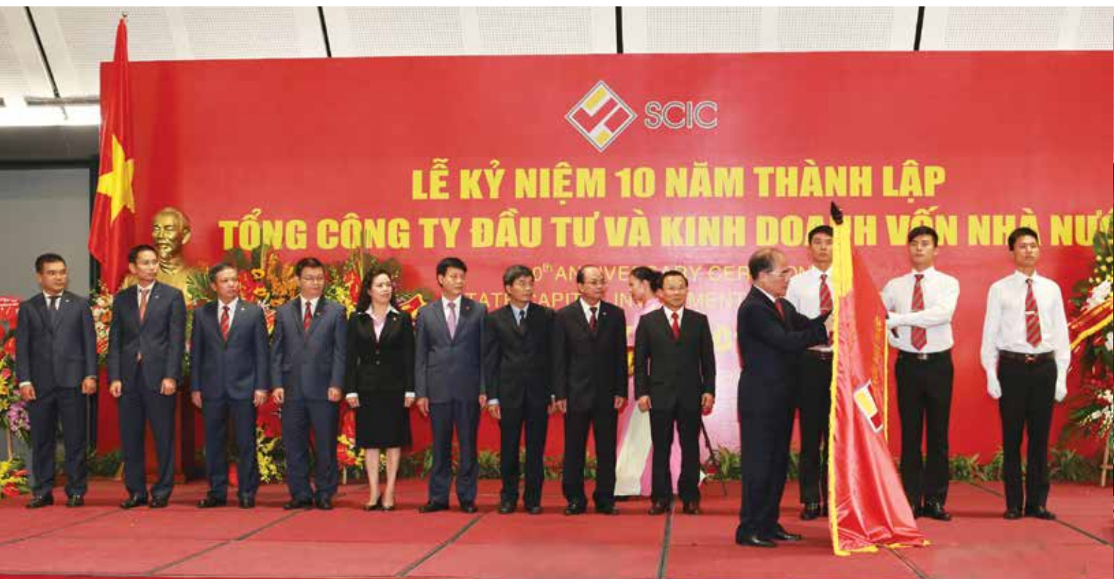
Chủ tịch Quốc hội Nguyễn Sinh Hùng gắn Huân chương Lao động hạng Nhất lên lá cờ truyền thống của SCIC.