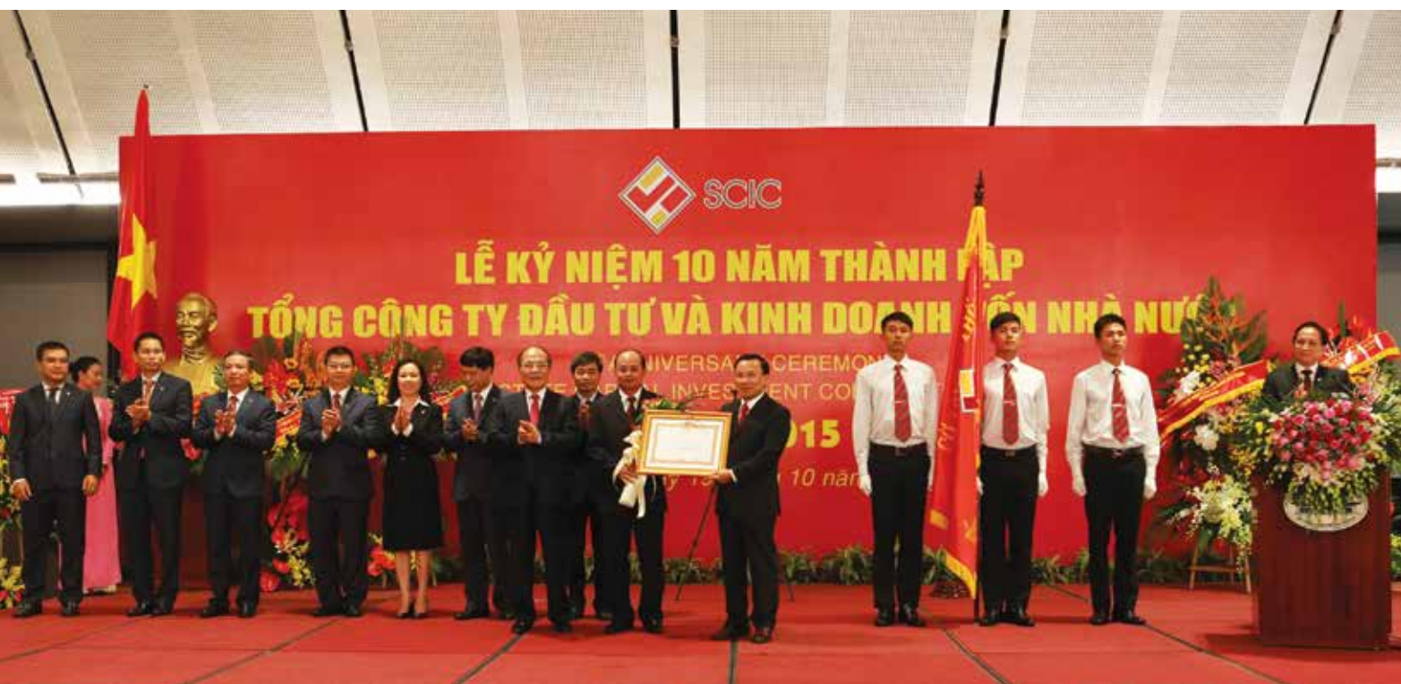
Chủ tịch Quốc hội Nguyễn Sinh Hùng trao tặng Huân chương Lao động hạng Nhất cho SCIC.