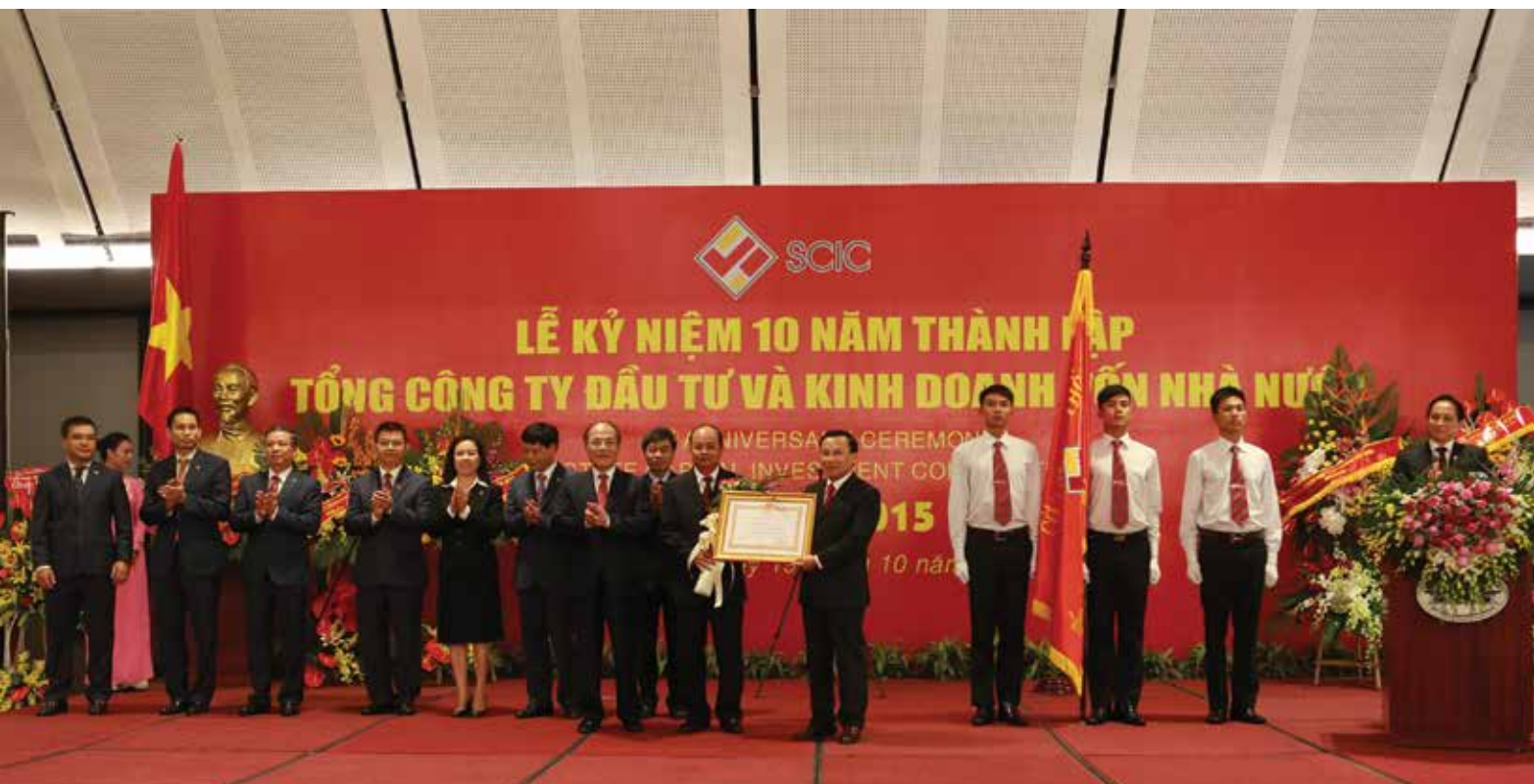
Chủ tịch Quốc hội Nguyễn Sinh Hùng trao tặng Huân chương Lao động hạng Nhất cho SCIC.