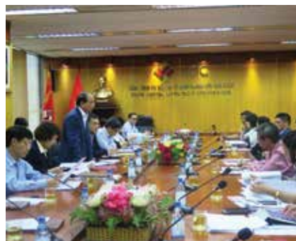
Quang cảnh buổi hội thảo.

Với vai trò là nhà đầu tư chiến lược của Chính phủ, SCIC đã nghiên cứu và đưa ra đề cương sơ bộ, trong đó mục tiêu chính của dự án là xây dựng một trung tâm công nghệ y – sinh học có cơ sở vật chất, hạ tầng nhà xưởng, các dây chuyền sản xuất hiện đại theo công nghệ EU và G7, đạt các yêu cầu tiêu chuẩn quốc tế