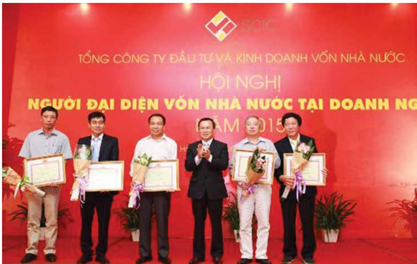
Thứ trưởng Bộ Tài chính, Chủ tịch HĐQT SCIC trao bằng khen cho người đại diện vốn nhà nước có thành tích tiêu biểu.