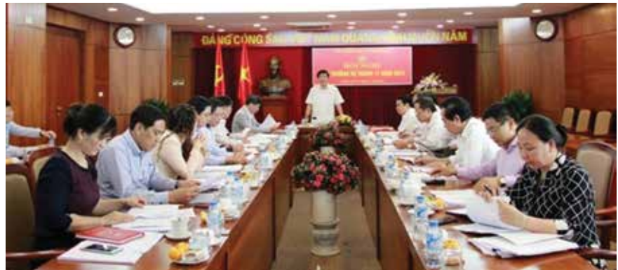
Ban Thường vụ Đảng ủy Khối Doanh nghiệp Trung ương họp phiên thường kỳ tháng 11/2015.