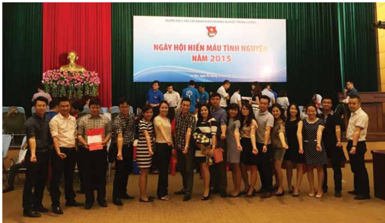
Các cán bộ SCIC tham gia Ngày hội Hiến máu tình nguyện năm 2015